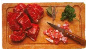
Daube de taureau de Camargues

Pouvez-vous donner la région correspondant aux produits suivants :