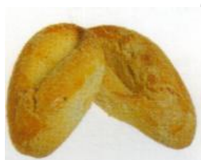
Navette de Saint Victor