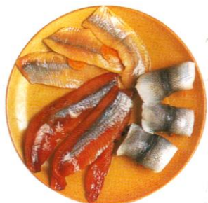
Harengs fumés, harengs roulés

Pouvez-vous donner la région correspondant aux produits suivants :