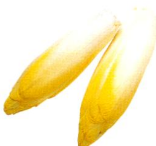
Endives ou chicons