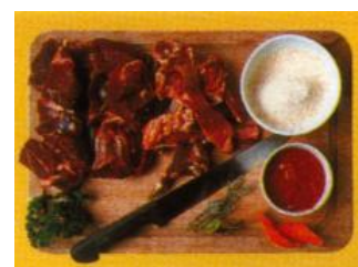
Ragoût de Cabri