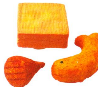
Maroilles, boulette de Cambrais